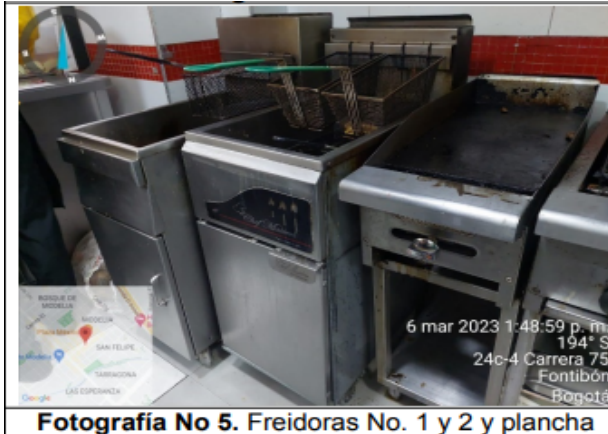
Fotografía No 5. Freidoras No. 1 y 2 y plancha