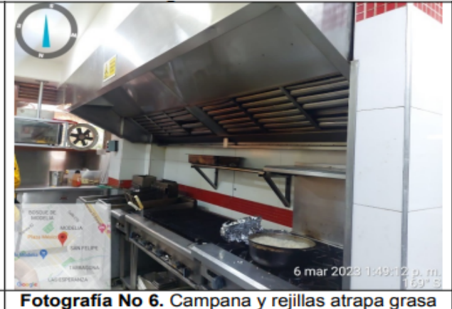
Fotografía No 6. Campana y rejillas atrapa grasa